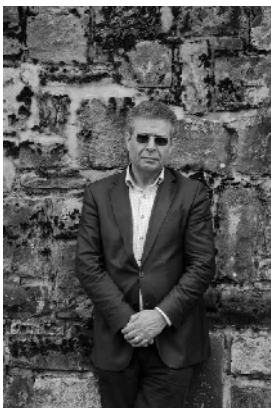
Nouri Al-Jarrah ©Umar Timol

La poésie arabe en France n'est connue qu'à travers un certain nombre de figures souvent politiques à l'instar du grand poète palestinien Mamoud Darwich ou d'un autre grand poète syrien Adonis. Aujourd'hui, avec Nouri Al-Jarrah, dans la collection Nyx dédiée aux littératures arabes, nous allons essayer d'inaugurer un nouvel âge. Un âge où la littérature arabe, la plus belle, la plus courante, la plus engagée, la plus humaine, sera à l'honneur, sera lue, découverte, visitée. Une barque pour Lesbos est quasiment le dernier grand poème de Nouri Al-Jarrah publié en 2016, et nous l'avons traduit pour dire notre amour de la méditerranée mais aussi pour crier haut et fort notre tendresse, notre humanité qui se trouve menacée à chaque instant avec tous les réfugiés syriens et autres qui trouvent la mort en méditerranée. Une barque pour Lesbos est l'épopée du peuple syrien martyr, peuple qui vit une guerre civile depuis plus de cinq ans. Et Nouri Al-Jarrah fait partie de ces poètes engagés qui sont contre la dictature, la dictature du régime actuel mais aussi, contre la barbarie et le fanatisme islamiste. C'est pour ainsi dire une troisième voix. La voix et la voie de la sagesse, la voie de la raison qui est malheureusement aujourd'hui minoritaire. Mais à travers la poésie, à travers la pensée, à travers l'écriture, je suis sûr qu'elle gagnera et qu'elle fera de la Syrie le grand pays qu'il était et qu'il est toujours. Aymen Hacem, le 24 septembre 2016