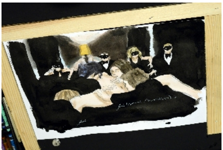
Arnaud Poujol, auteur Guillaume Trouillard, dessinateur